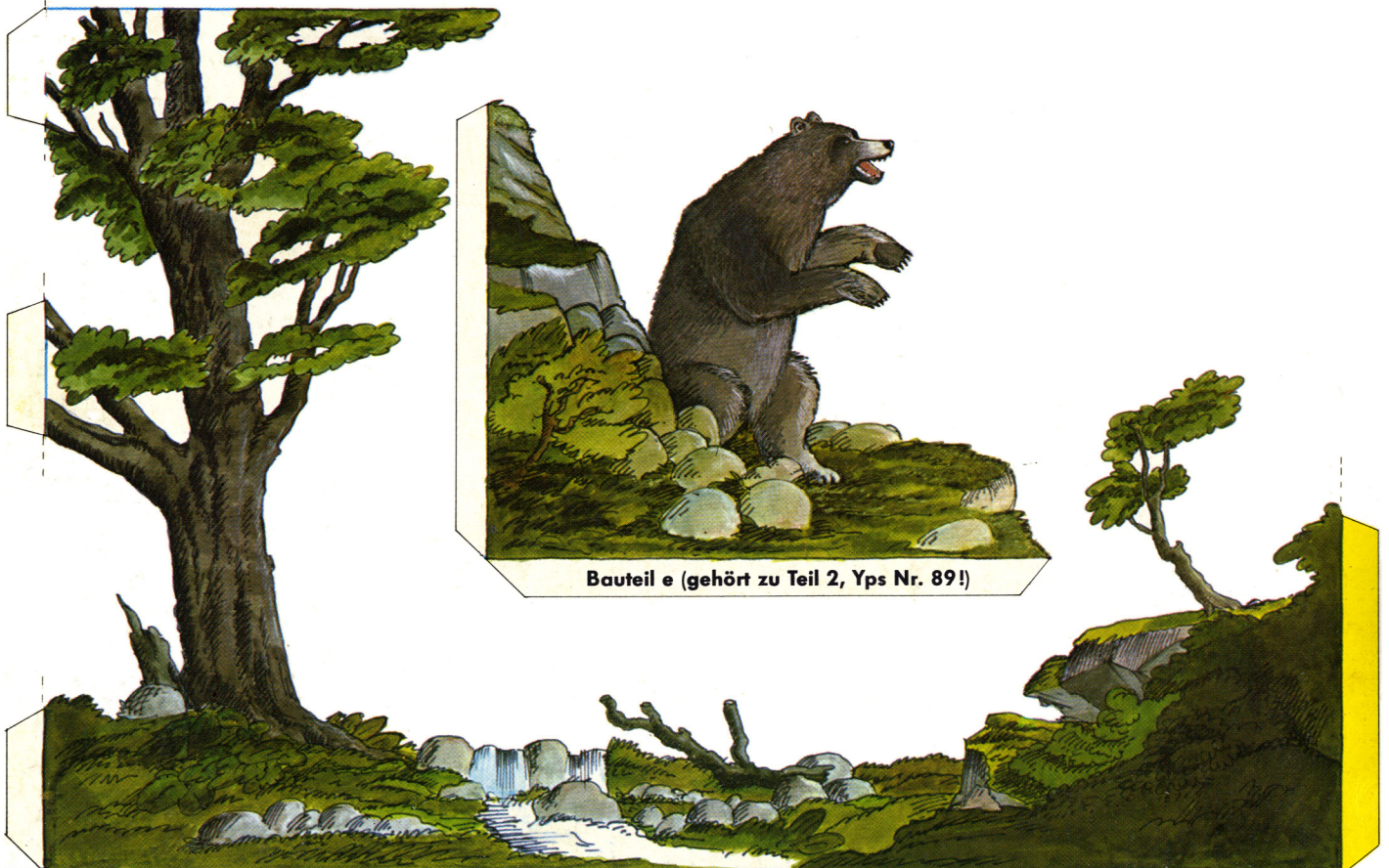
Bauteil e (gehört zu Teil 2, Yps Nr. 89!)