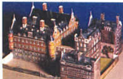
Das ist die Gesamtansicht eures fertigen „Scotland Yard“.

So sieht der komplette Grundriß von „Scotland Yard“ aus. Falls ihr es noch nicht gemacht habt: den Grundriß auf mindestens 25 x 30 cm großen dicken Karton übertragen – am Schluß werden die Gebäudeteile darauf aufgeklebt.